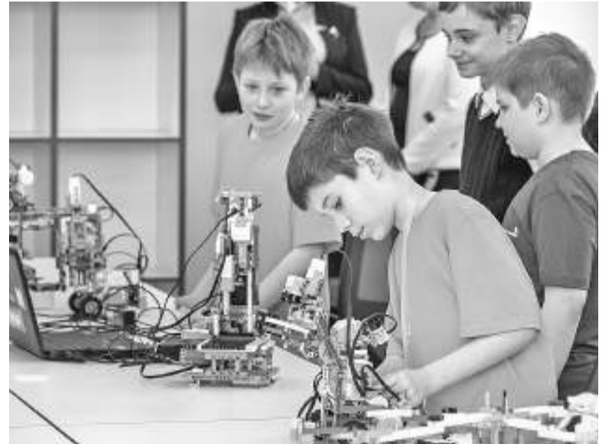
Студия робототехники Шуховского лицея