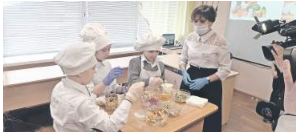
На внеурочке, посвящённой правильному питанию, ученики школы с УИОП готовят вкусные и полезные блюда